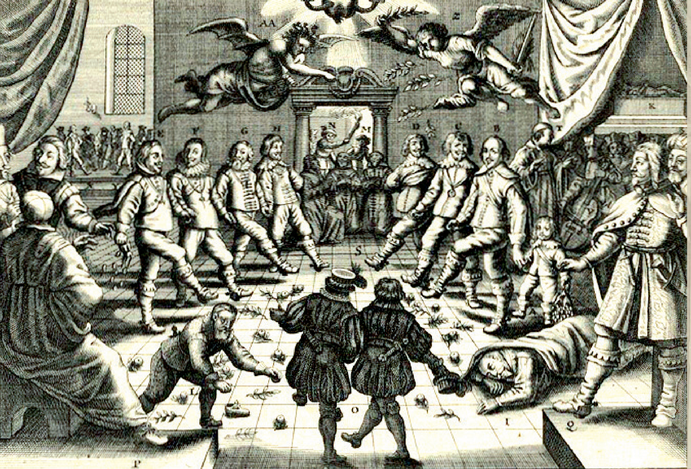
Foto: Groß Europisch Kriegs=Balet; CC-BY-NC-SA @ Kulturstiftung Sachsen-Anhalt, Kunstmuseum Moritzburg